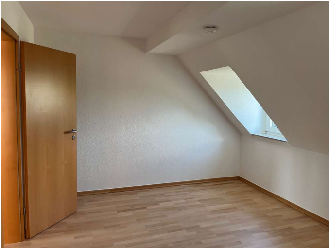
Schlafzimmer Rtg. Diele