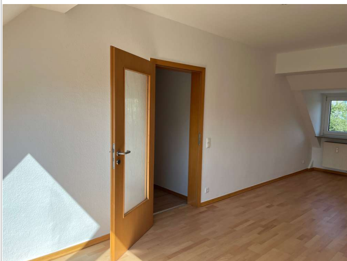
Wohnzimmer Rtg. Diele