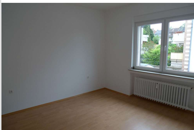
Kind / Arbeiten 2