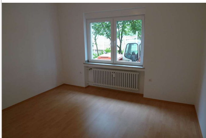
Kind / Arbeiten 1