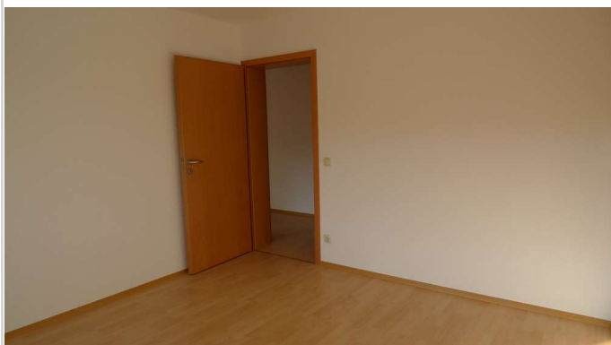
Schlafzimmer Rtg. Diele