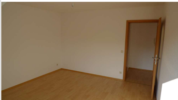
Wohnzimmer Rtg. Diele